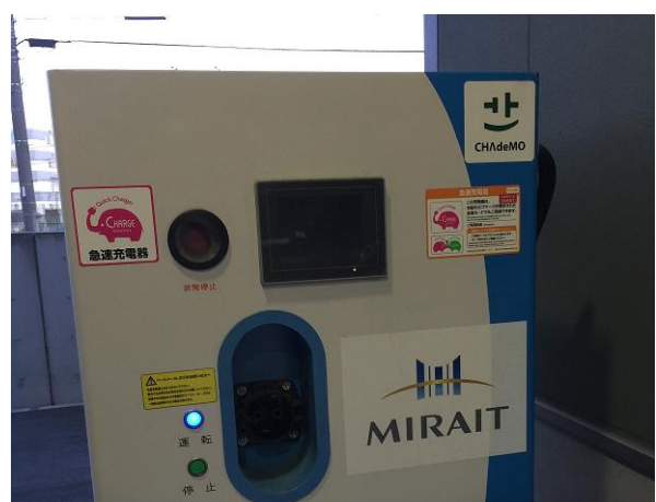
NCS ネットワークに繋がった充電器の証である「チャージスルゾウ」ステッカー(ピンク)がつけました