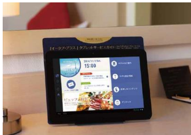
『ee-TaB*®(イータブ・プラス)』イメージ