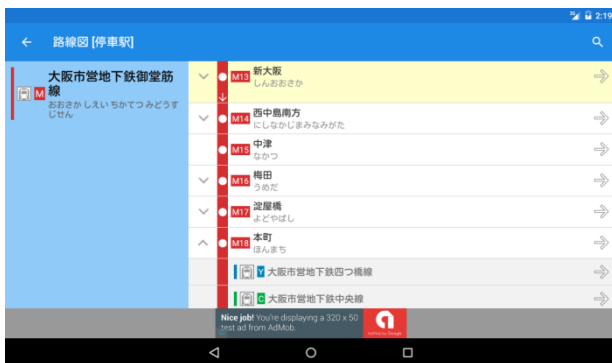
停車駅の案内表示