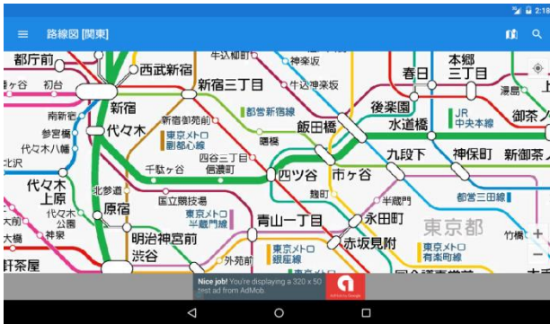
北海道から沖縄まで日本全国の路線をカバー