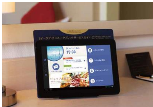
イータブ・プラス画面イメージ

今後も全国のホテルを対象に、イータブ・プラスのサービス提供地域を広げるとともに、さまざまな形態のホテルへの導入を目指していきます。