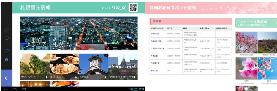
画面イメージ・観光情報(札幌)