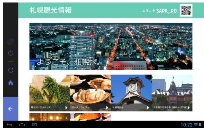
画面イメージ・観光情報