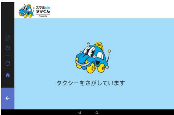
画面イメージ・タクシー呼出