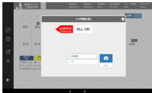
画面イメージ・遺失物管理機能