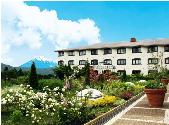
ホテルグリーンプラザ箱根

本サービス機能に加え、今後は『レストラン混雑状況表示』や『客室オーダーシステム』なども導入予定となっており、イータブ・プラスの導入により様々なゲストのニーズに応えるとともに、運営スタッフの業務効率向上に貢献していきます。