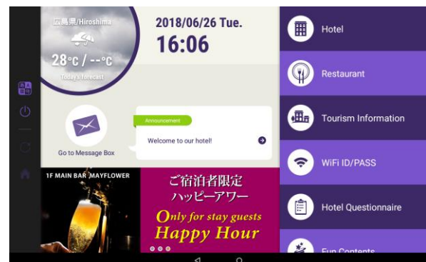
タブレットイメージ