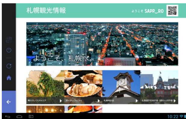
画面イメージ・観光情報