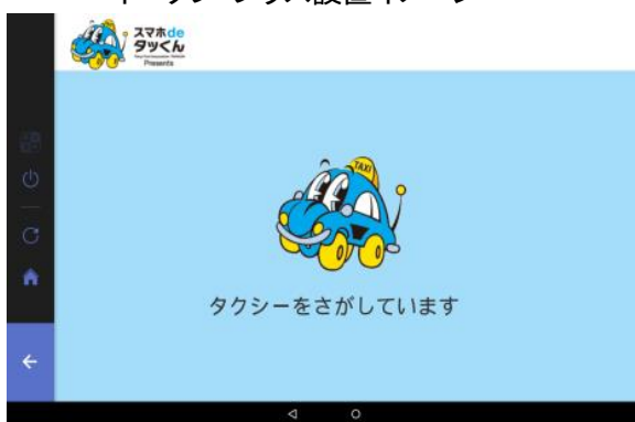
画面イメージ・タクシー呼出