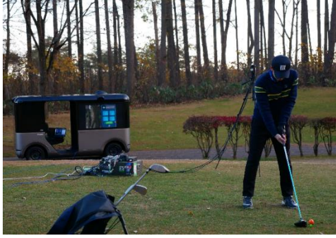
<ショットを撮影している様子>