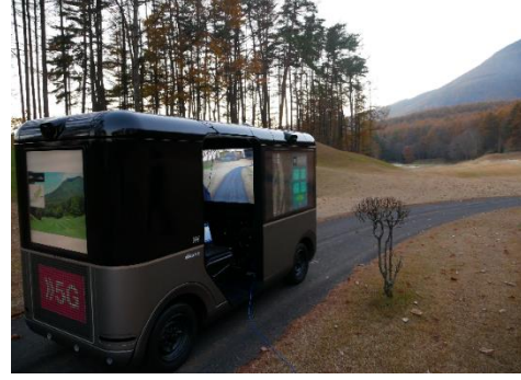
<次世代ディスプレイカートの画面に投影している様子>