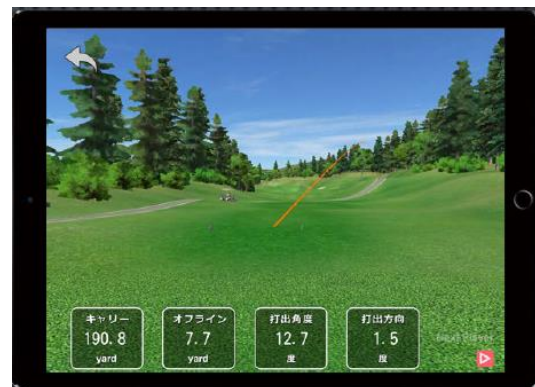
<同3Dマップモード画面>