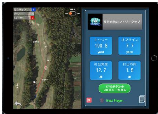
<落下地点予測のミニマップモード画面>

ティー後方にカメラを設置し、撮影したショット映像を富士通および株式会社GPROが提供する弾道分析システム(注1)により分析し、ボールの落下地点予測を実施しました。その予測結果を、5Gを介して次世代ディスプレイカートおよびプレーヤーのタブレットに表示させることに成功しました。これにより、プレーヤーのボール探しの時間短縮が見込まれ、プレーの回転率を向上することでゴルフ場の経営改善に貢献できる可能性があります。