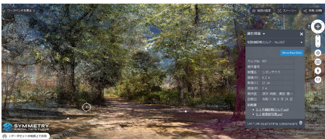
渋谷区を持つ樹木の診断カルテ情報などのデータを可視化

今後、ササハタハツエリアの3次元データや、区を持つデータなどを閲覧できるよう準備を進めています。また、ワークショップなどで出た地域にお住いの皆様等の意見をデジタルツイン上に表示させることで、ササハタハツエリアにおける地域にお住いの皆様等の意見反映に役立てていきます。