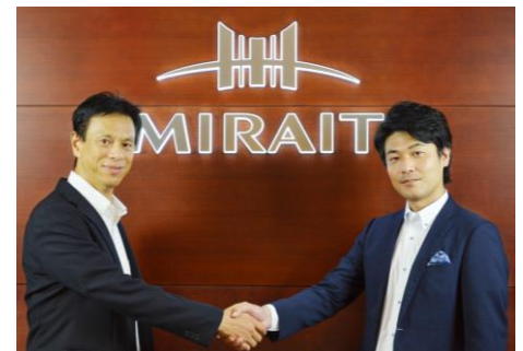
アルファコム野社長(右)と ミライト情報システム岡本社長(左)