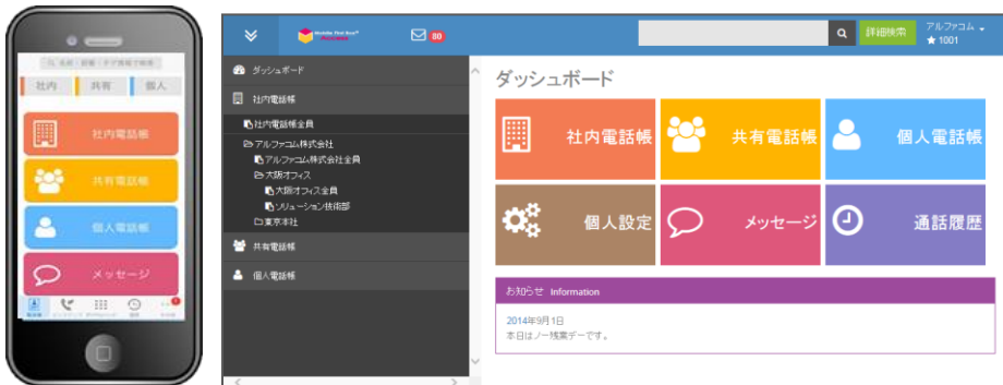
Mobile First Box®Access 操作画面

当社のグループ会社である株式会社ミライト情報システム(本社:東京都品川区、代表取締役社長:岡本 充由、以下「ミライト情報システム」)は、アルファコム株式会社(東京都中央区、代表取締役社長:野 龍次、以下「アルファコム」)と業務提携し、クラウド電話帳ソリューション「Mobile First Box®Access」の提供を開始いたします。本サービスは個人情報を含む電話帳データをクラウドで一元管理することにより端末紛失による情報漏えいを防ぐなど、スマートデバイスによる業務効率化やコスト削減をセキュアに実現します。