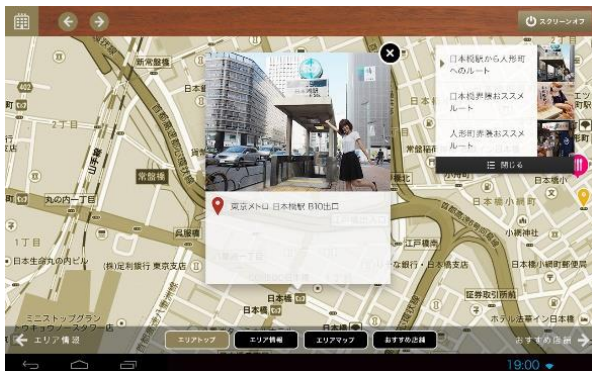
ホテル周辺のおススメ情報

http://sls.mrt.mirait.co.jp/specialcontents/eetabplus/