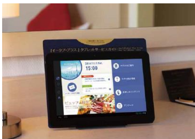
『ee-TaB*®(イータブ・プラス)』イメージ

【ホテル・旅館様などから『ee-TaB*®』 サービスに関するお問い合わせ】 株式会社ミライト イータブ・プラス推進部 TEL: 03-6807-3157 Email: eetab-plus@mirait.co.jp