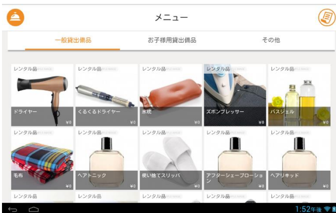
「客室オーダー機能」画面イメージ

「客室オーダー機能」はルームサービス、バスタオル・歯ブラシなどのアメニティ、または子供用ブランケットやズボンプレスナーなどの貸出品を客室に設置されたイータブ・プラスから注文できる機能です。本機能はボクシーズ株式会社が提供する「Putmenu(プットメニュー)」のプラットフォームを活用したもので、管理用タブレットと専用のプリンタを使用し、専用アプリをインストールすることで利用できます。宿泊客の操作により商品の種類・数量が指定されると、Wifi 経由で注文内容が送信され、管理タブレットに状況が表示されるとともに専用のプリンタから伝票が出力される仕組み。宿泊利用者が電話をかける手間やストレスを軽減し顧客満足度の向上が図れるとともに、ルームサービスやアメニティ注文に関する電話着信を削減し、ホテルスタッフの業務効率化を図れます。