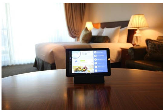
イータブ・プラス設置イメージ

※記載されている会社名および商品名/サービス名は、各社の商標または登録商標です。