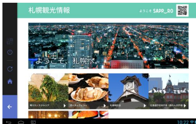
画面イメージ・観光情報