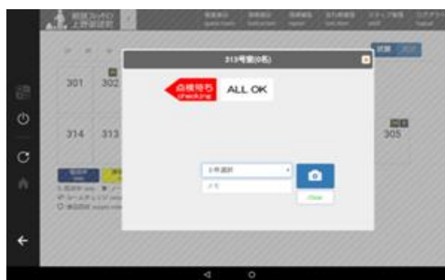
画面イメージ・遺失物管理機能

【ee-TaB*®サービスに関するお問い合わせ先】 株式会社ミライト イータブ・プラス推進部 TEL:03-6807-3157 Email: eetab-plus@mirait.co.jp