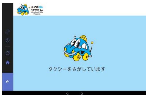
画面イメージ・タクシー呼出