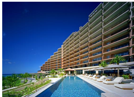
カフー リゾート フチャク コンド・ホテル

今後も全国の宿泊施設を対象にイータブ・プラスのサービス提供地域を広げ、事業者の業務効率改善及び客室の付加価値向上に貢献していきます。