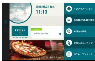
タブレット画面イメージ