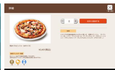
デリバリー注文画面イメージ