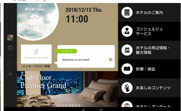
イータブ・プラス画面イメージ