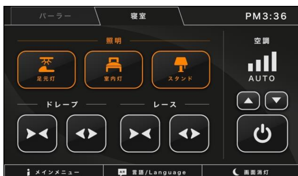
客室内設備のリモートコントロール機能画面

今後もさまざまな分野での利用拡大に向け、各施設に適した機能の開発を進めていきます。