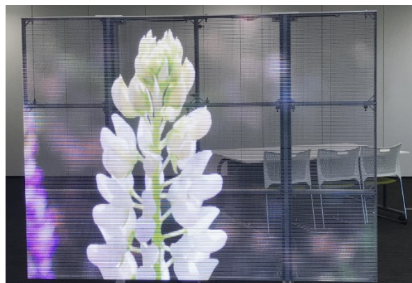
透過型 LED ディスプレイ「Creative Window 華窓」イメージ