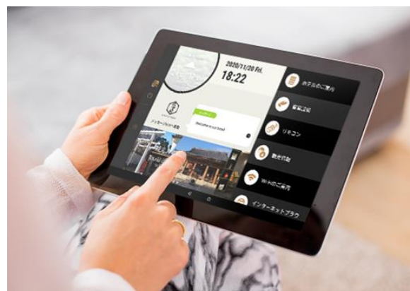
タブレットイメージ