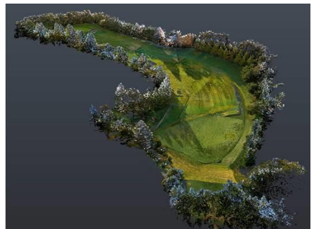
点群データ イメージ画像