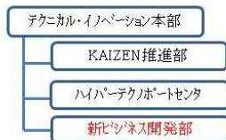
組織図2(機構改革③・④)