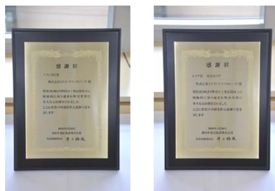
感謝状（ベスト会社賞、エリア賞）

今後も、当社の技術力のさらなる向上を図ることにより、高品質なサービスの提供に努めてまいります。