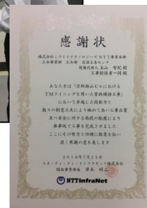
感謝状授与模様（左から） NTT インフラネット 関西事業部 エリアマネジメント部 東部長 当社 京滋土木センタ 玉山現場代理人

今後とも、当社の技術力のさらなる向上を図ることにより、高品質なサービスの提供に努めてまいります。