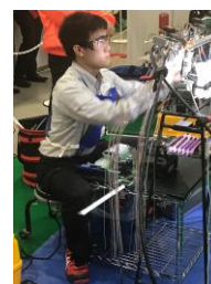
競技の様子：総田社員

当社は今後も競技会への参加などを通じ、当社の更なる現場力向上を図ることにより、安全・安心・高品質なサービスの提供に努めてまいります。