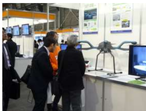
説明模様（全天候型ドローン）